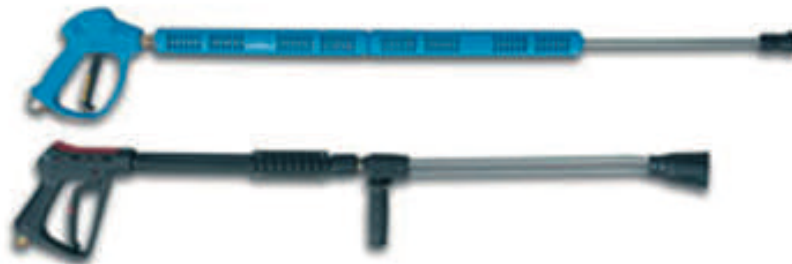
Pistola de agua a presión

El número de coches/hora que lava un tren es muy variable según el modelo de máquina, pudiendo ir desde 20 coches hora hasta 100 coches hora. El consumo de agua también es muy variable debido a la gran variabilidad de configuraciones que pueden darse (más o menos módulos de cepillos, altas presiones, lavados de bajos).