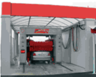
Puente de lavado