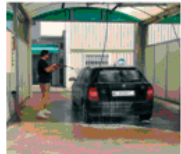
Box de lavado