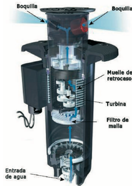
Figura 3. Ejemplo de aspersor de turbina

Son equipos que disponen de una turbina que aumenta el alcance del chorro de agua y permite el desplazamiento del chorro a lo largo de una sección del terreno. Las partes más importantes pueden verse en el ejemplo de la figura 3.