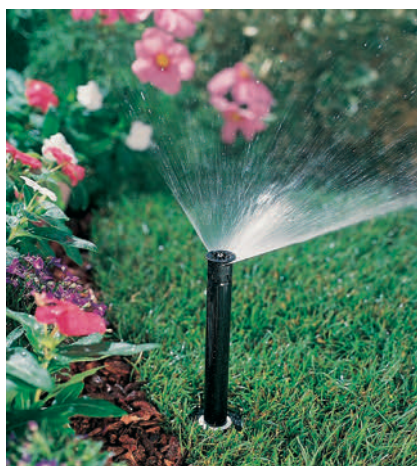
Figura 2. Ejemplo de difusor